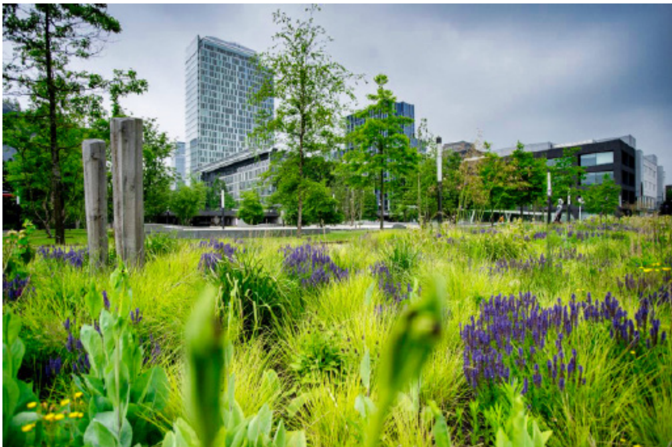
Amsterdam Prinses Amaliaplein.